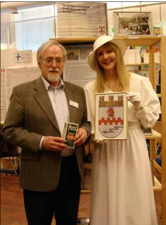
Besuch der „Weißen Dame“ von Henkel an unserem Stand. Werbung für Benrath. Irgendetwas stimmt hier nicht.